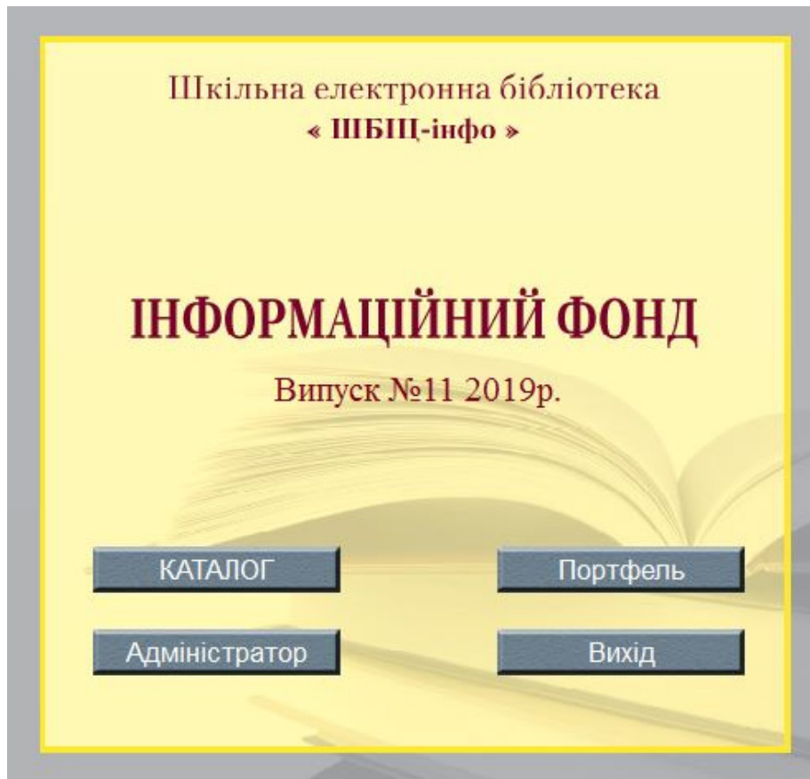
Головна панель АБІС «ШБІЦ-інфо»